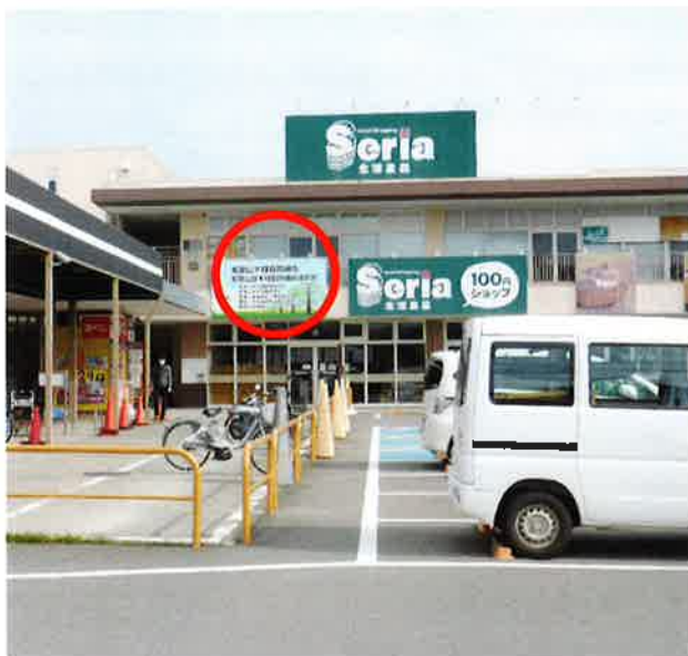
1F 駐車場から ○箇所

〒640-8404 和歌山市湊45番2 TEL.073-499-5467 FAX.073-499-5469